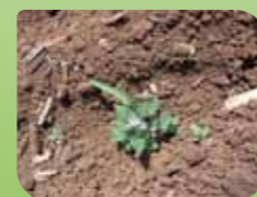
Bela metlika Chenopodium album