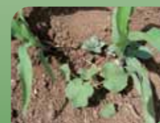
Baržunasti oslez Abutilon theophrasti