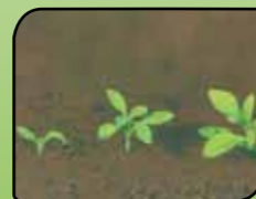
Plezajoča lakota Galium aparine L.