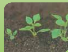
Navadna zvezdica Stellaria media