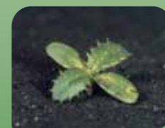
Njivski osat Cirsium arvense