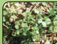
Bršljanastolistni jetičnik Veronica hederifolia