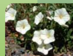
Njivski slak Convolvulus arvensis