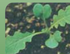
Njivska gorjušica Sinapis arvensis L.