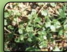
Bršljanolistni jetičnik Veronica hederifolia