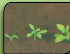
Plezajoča lakota Galium aparine L.