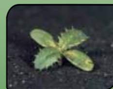
Njivski osat Cirsium arvense