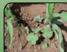
Baržunasti oslez Abutilon theophrasti