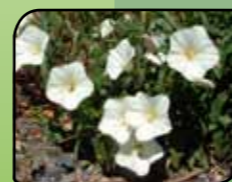
Njivski slak Convolvulus arvensis