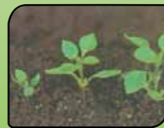
Navadna zvezdica Stellaria media